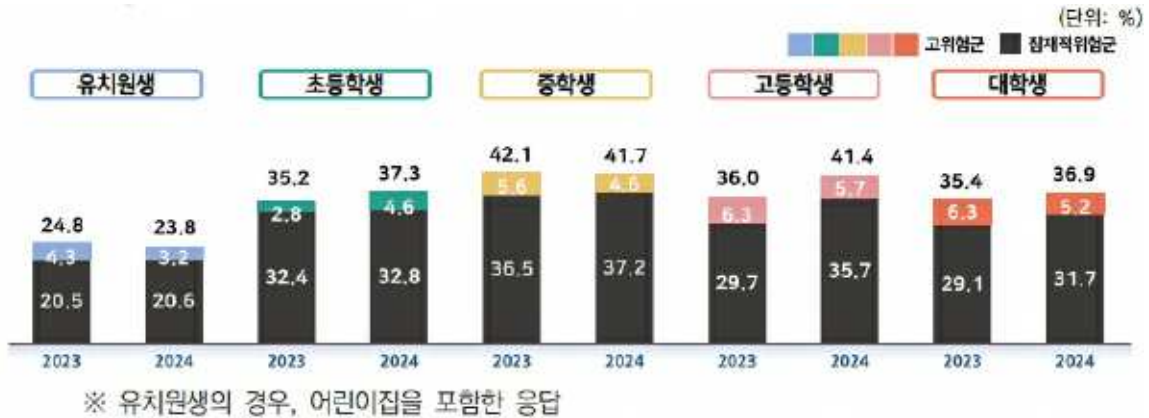
학령별 스마트폰 과의존위험군 비율