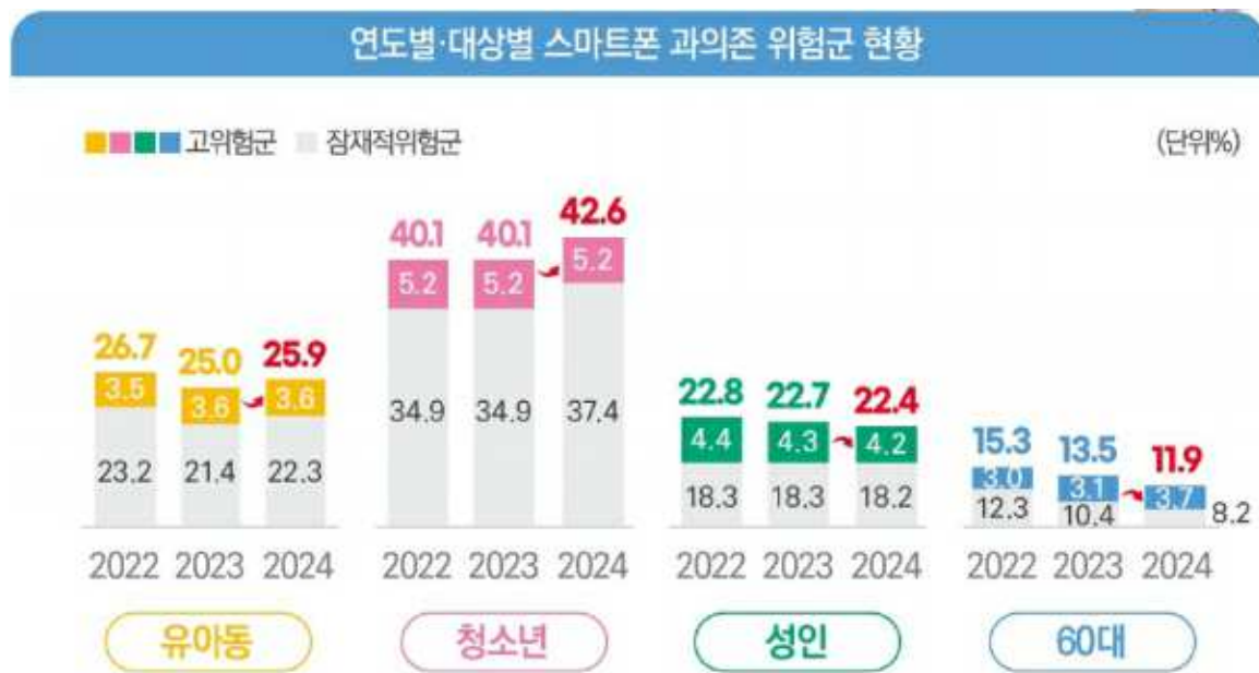
연도별 대상별 스마트폰 과의존 위험군 현황

- 스마트폰 과의존 위험성이 가장 높은 대상은 청소년으로 나타났으며, 2023년 대비 2024년 잠재적위험군 비율이 2.5%p 증가했습니다.